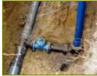
Sieć wodociągowa w Gminie Michałów

w stosownych przepisach. Powoduje to szczególnie na terenach zalewowych dostęp wody zanieczyszczonej. W części gospodarstw wykonane są wodociągi przyzagrodowe, gdzie woda ze studni za pomocą pomp i urządzeń hydroforowych rozprowadza jest po gospodarstwie. Część budynków posiada podłączenia kanalizacyjne do bezodpływowych zbiorników ścieków, pozostałe nie są skanalizowane. Projekt pozwoli doprowadzić wodę do gospodarstw w miejscowościach Michałów, Zagajów, Gajówek, Karolów. Realizacja tego przedsięwzięcia jest podstawą budowy infrastruktury kanalizacyjnej. Realizacja tego projektu przewidziana jest w „Strategii Rozwoju Gminy Michałów” oraz w „Planie Rozwoju Lokalnego”.