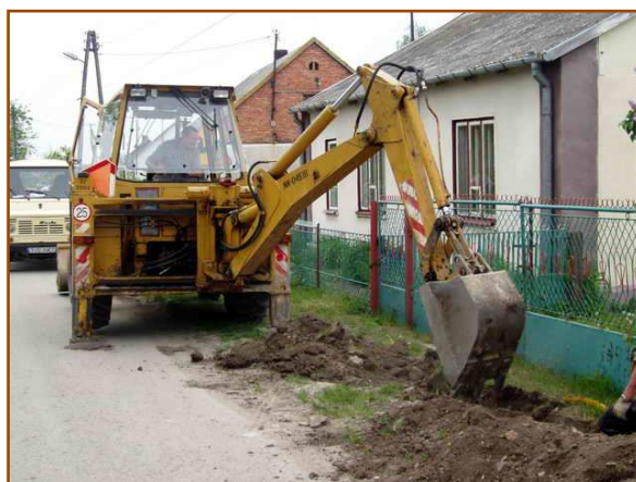
Trwające prace nad budową sieci wodociągowej

Realizacja tego projektu wpłynie pozytywnie na rozwój gospodarczy i wzrost atrakcyjności turystycznej gminy. Następstwem czego stworzą się warunki do zmniejszenia bezrobocia oraz osób zatrudnionych w rolnictwie do usług i drobnego przetwórstwa. Przesunięcie osób uprawiających niewielkie areły ziemi do zatrudnienia poza rolnictwem jest czynnikiem zwiększającym mobilność zawodową. Następnym celem realizacji projektu jest symulacja lokalnej inicjatywy. Tworzące się komitety do spraw wodociągowania wpłyną pozytywnie na świadomość i zmniejszenie alienacji mieszkańców wobec poczynań dotyczących ich samych.