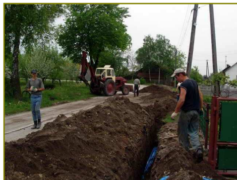
Michałów w trakcie budowy wodociągu