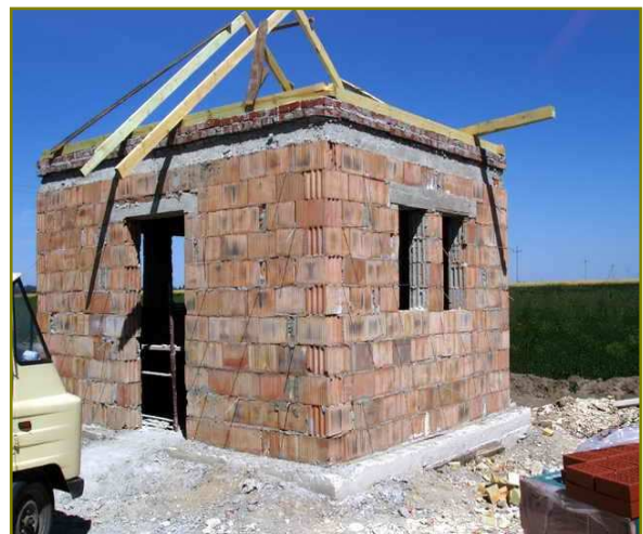
Przepompownia w Michałowie (w trakcie budowy)

Projekt zakłada podłączenie w miejscowościach Michałów, Zagajówek, Zagajów, Karolów a docelowo terenu całej gminy do nowego ujęcia wykonanego w 2004 roku w Zagajowie. Woda z tego ujęcia nie wymaga na dzień dzisiejszy uzdatniania, natomiast jej ilość gwarantują zaopatrzenie w wodę wszystkich mieszkańców z rezerwą dla przyszłych niewielkich przedsiębiorstw funkcjonujących na bazie dobrej jakości wody. Woda z ujęcia w Zagajowie jest transportowana do stacji wodociągowej w miejscowości Góry.